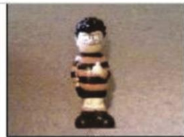
LS Long Shot