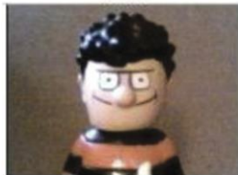
MCU Medium Close-Up