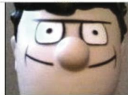
BCU Medium Close-Up