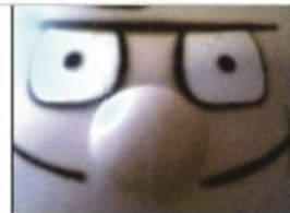
XCU Extreme Close-Up