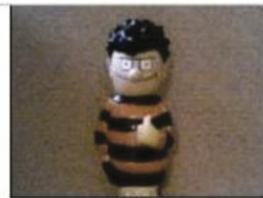
MLS Medium Long Shot