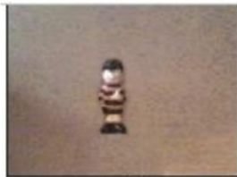
XLS Extra Long Shot