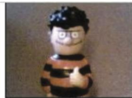
MS Medium Shot